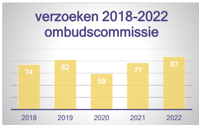
Figuur 1: verzoeken vanaf 2018 tot 2022

In 2022 ontving de ombudscommissie telefonisch, per mail en via de website 87 verzoeken. In 2021 waren er in totaal 77 verzoeken.